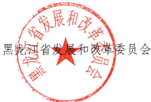
黑龙江省发展和改革委员会