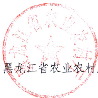
黑龙江省农业农村厅